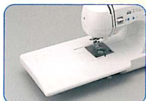
大型テーブル 大きな布地もラクラクの大型テーブル付